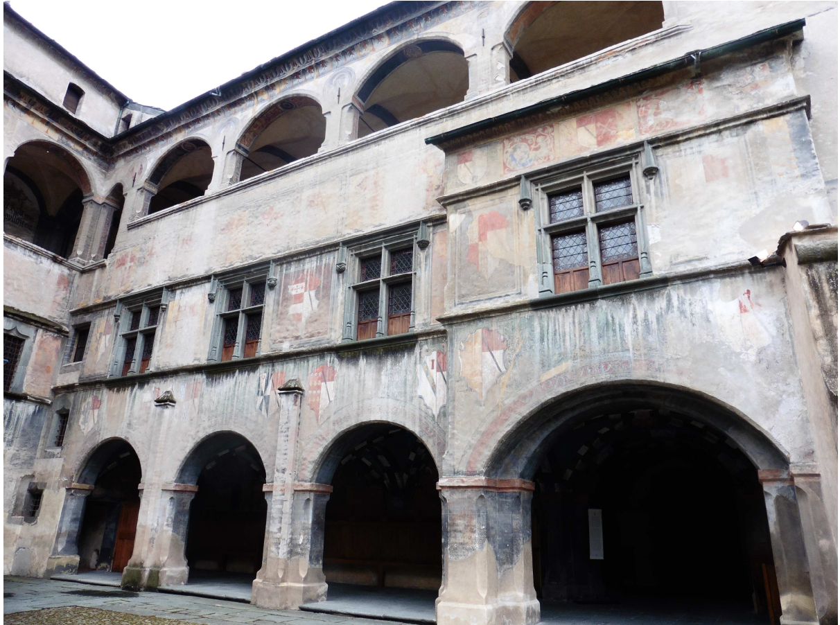
Cour intérieure, aile d'entrée du château