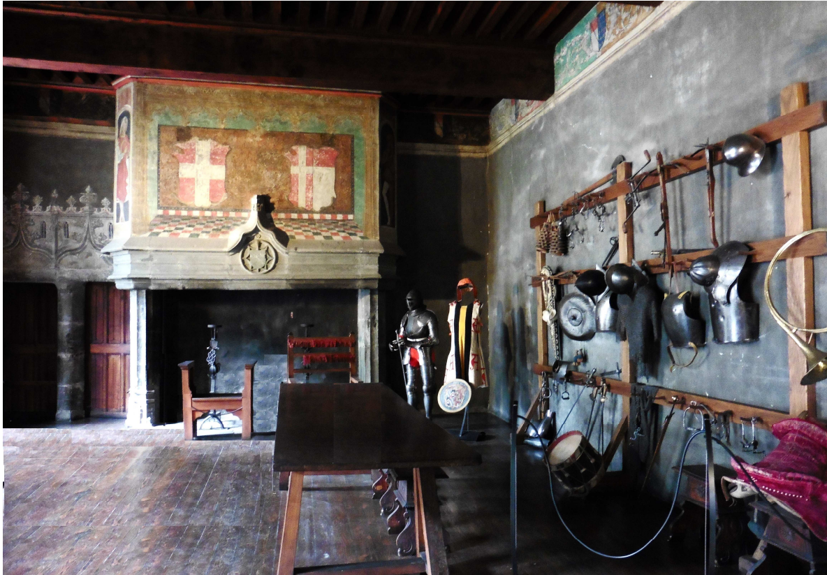
La chambre « de Savoie », transformée en salle d'armes