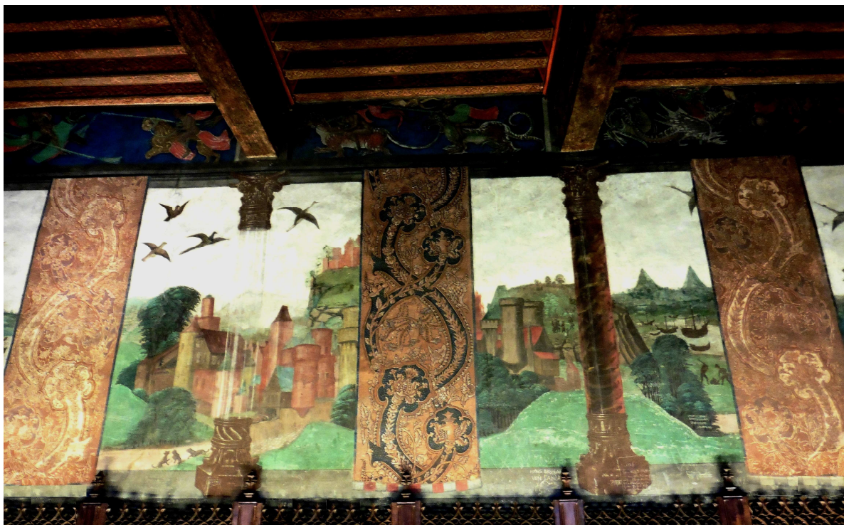
La grande salle, dite salle de justice