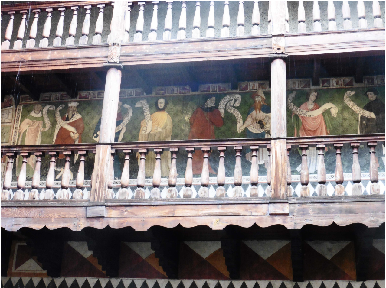
Fresque des sages et des philosophes antiques (cour intérieure, galerie de bois)