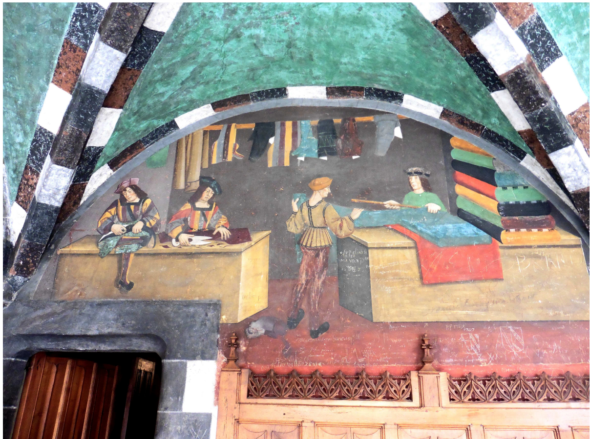
La boutique du tailleur, marchand de tissus