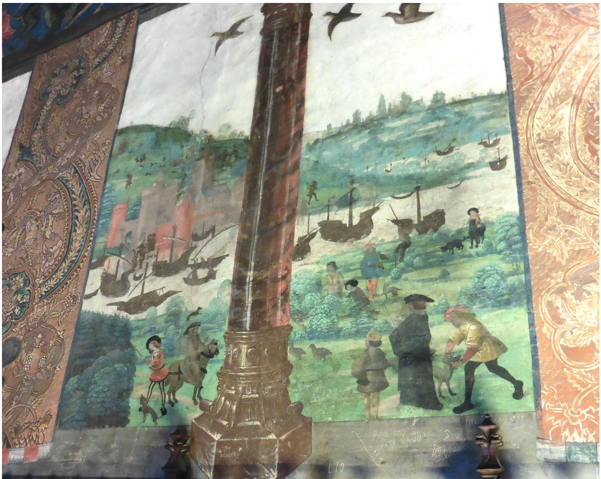
Grande salle, détail d'une fresque - paysage fluvial et scène de chasse