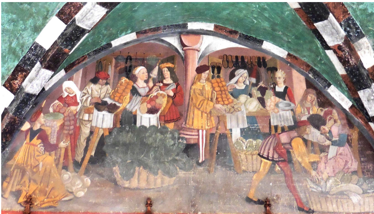
Le marché en ville