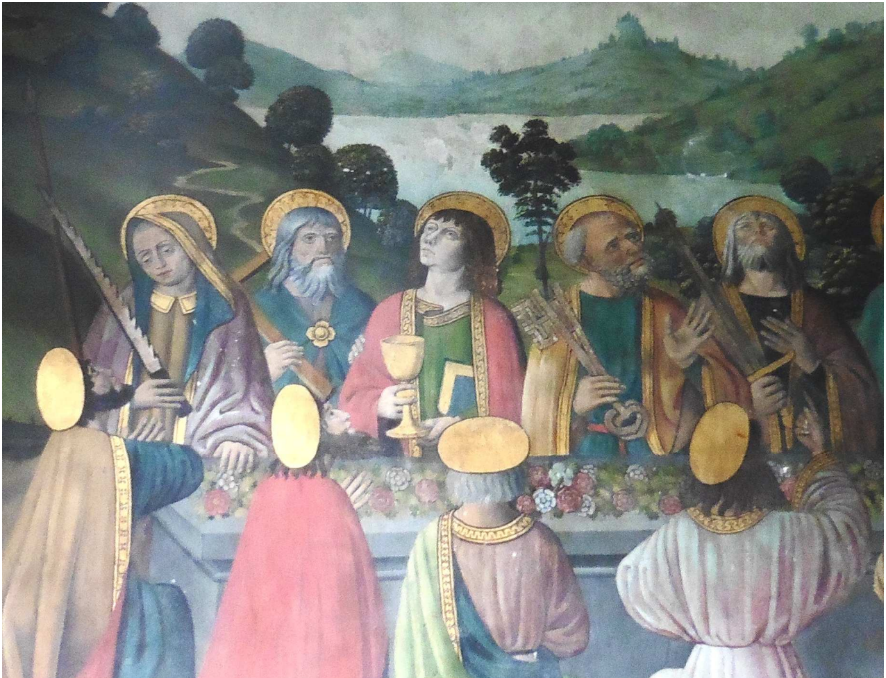
Oratoire privé de la comtesse, détail de l'Assomption de la Vierge

L'appartement de la comtesse comprend un oratoire, lieu de retrait où la châtelaine pouvait faire ses dévotions dans un décor particulièrement soigné. En effet, malgré son exigüité, cet espace intime et consacré à Dieu a été couvert de fresques, dont la délicatesse de touche et la variété des coloris évoque l'art des enluminures. Ainsi, la lecture des Heures et la récitation des prières pouvaient-elles s'accorder à cet univers pictural précieux, qui exaltait des scènes emblématiques de l'Histoire sainte et de l'hagiographie féminine, comme l'Assomption de la Vierge et les martyres des saintes Catherine et Marguerite.