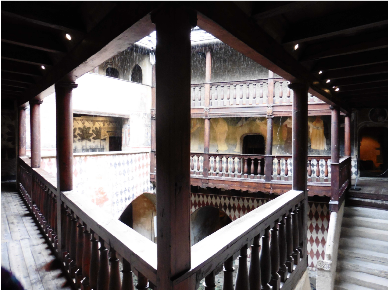
La cour d'honneur vue de la galerie de bois en encorbellement

Maître turinois du début du XV e siècle, Jaquerio est le plus célèbre peintre de son époque dans les États de Savoie. Représentant cet art raffiné qu'on a nommé « le gothique international », il est le peintre attitré d'Amédée VIII. À Fénis, Boniface I er de Challant lui commanda vers 1415 les fresques de la cour d'honneur (saint Georges tuant le Dragon, sages et philosophes de l'Antiquité), de la salle du tribunal (figures des quatre Vertus cardinales), et de la chapelle (Notre Dame de la Miséricorde, Crucifixion, saints et évêques). Comme on le voit, la décoration picturale du château obéit à un programme élaboré, qui met en valeur les aspirations morales et intellectuelles du maître de céans.